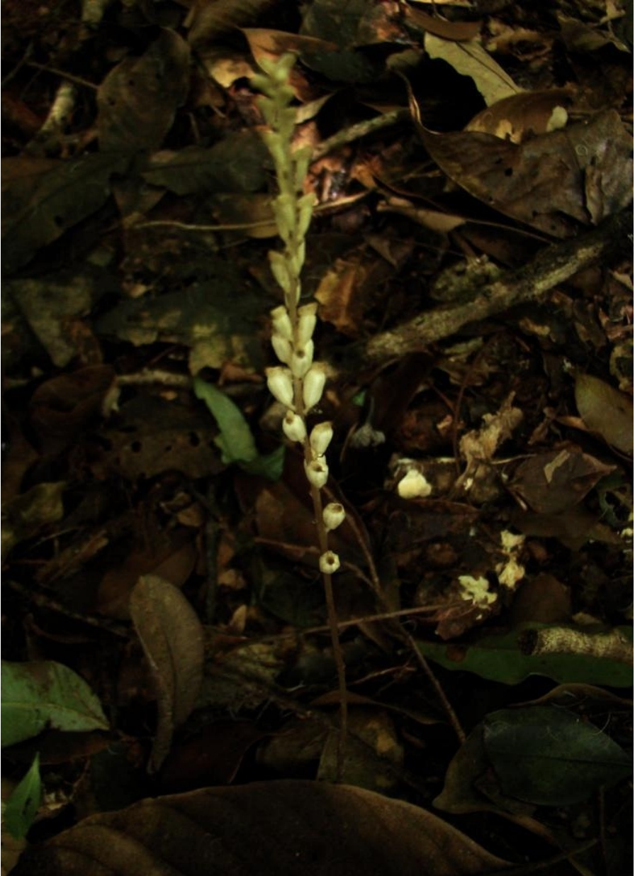
Fig. 2 : Wulfschaegelia aphylla in situ