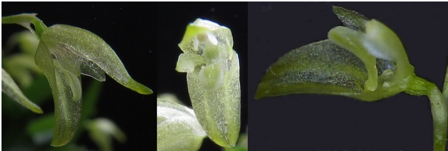
Fig. 4 : fleur de Specklinia viridiflora

Jusqu'ici Pleurothallis viridiflora était considéré comme une espèce rare, connue seulement de la localité type, dans la Serra dos Órgãos (Macaé, Rio de Janeiro). La distance géographique entre Macaé et Caraguatatuba (São Paulo, habitat des nouvelles observations ici rapportées) est d'environ 480 km à vol d'oiseau, sachant que les deux habitats font partie de la Mata Atlântica et se situent dans des forêts ombrophiles proches du littoral. Étant donné le nombre de plantes rencontrées et le nombre de lieux où elles poussent, ce taxon ne correspond plus à une espèce rare mais plutôt à une espèce relativement commune.