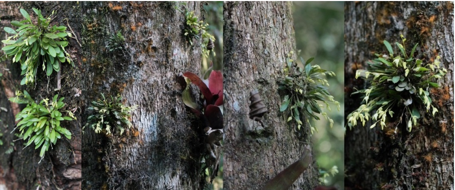
Fig. 3 : quelques plantes de Specklinia viridiflora in situ