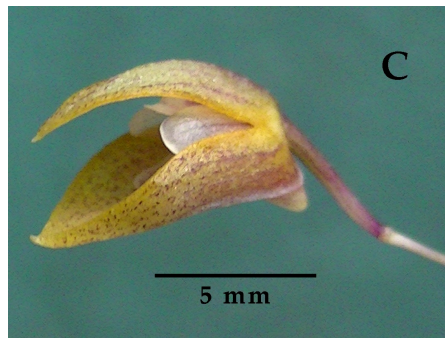
Fig. 1 : Pabstiella uniflora et Pabstiella yauaperyensis

A : aspect général de P. uniflora . B : fleur de P. uniflora . C : fleur de P. yauaperyensis .